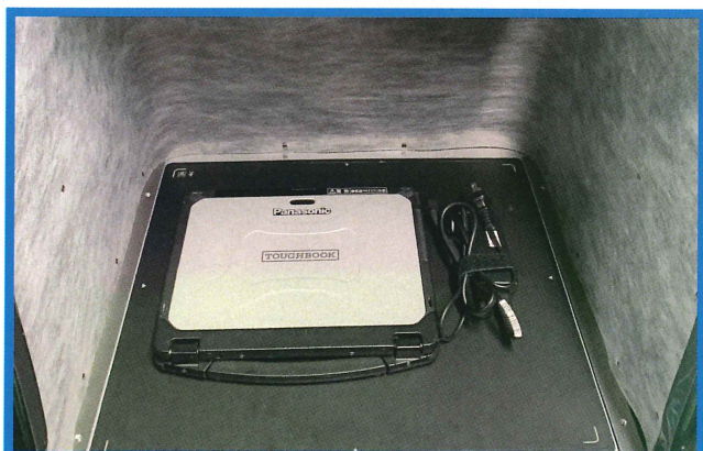
ノート PC と電源ケーブル